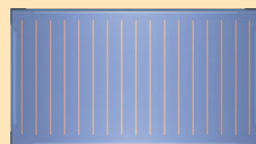
CAPTADORES FKC COMFORT